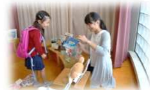
(ぬいぐるみおとまり会で手作りカードを渡す大学生のお姉さん)

皆さんの中には将来、幼稚園や保育園の先生になりたいと思っていたり、児童教育に興味を持っている人もいないでしょうか。そこでお手伝いに来てくれた東京都市大学人間科学部児童学科の方々に、いくつか気になることを質問してみましたよ。