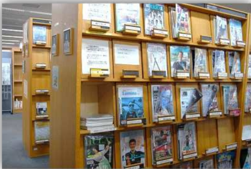
(中央図書館の1階の雑誌棚です。)

勉強などで疲れたら、自分の好きな雑誌を手にとって、ちょっと「ひと休み」してみませんか?