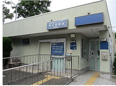
うめがおかとしょかんかりじむしょ 梅丘図書館仮事務所