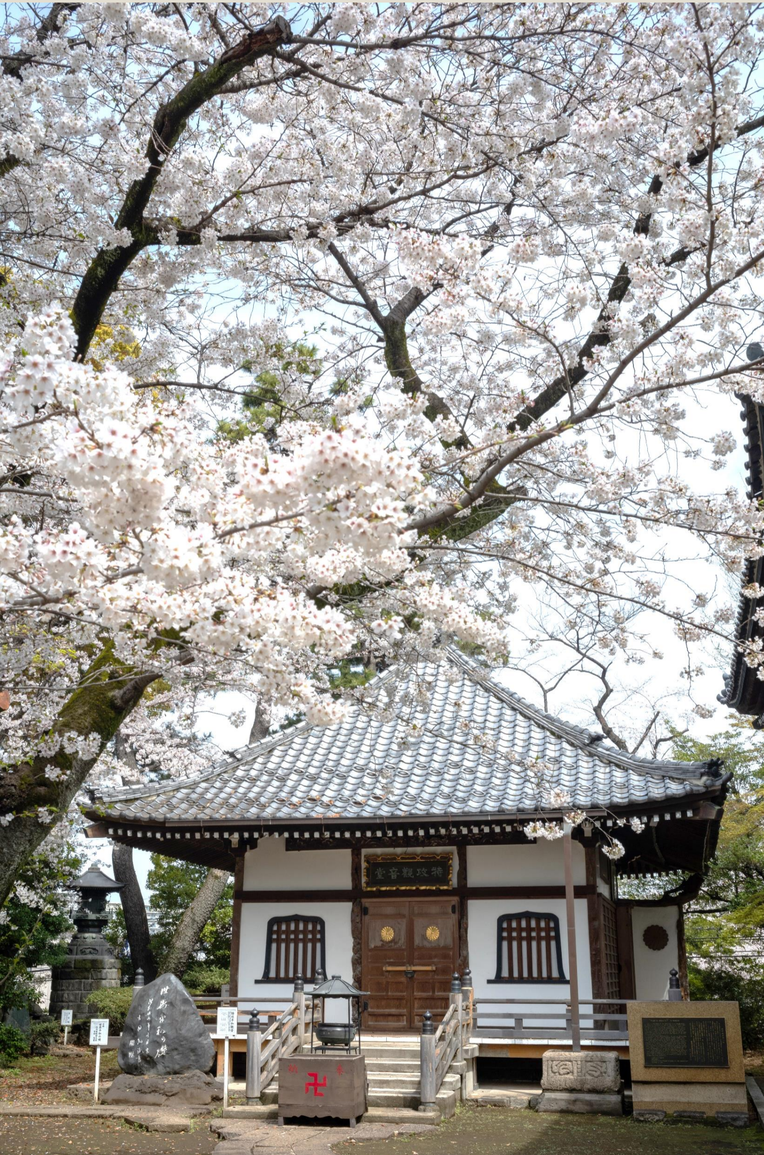
▲世田谷観音本堂に隣する特攻観音堂