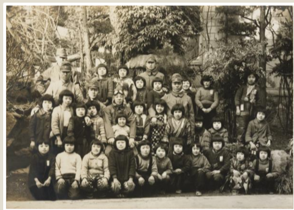
▲大原小学校の疎開児童と武揚隊隊員