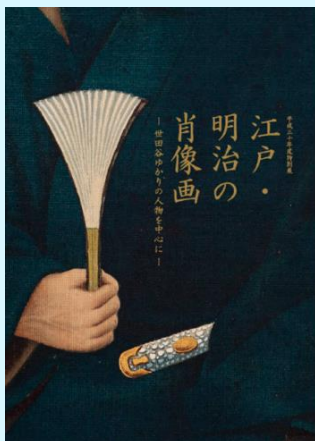
『江戸・明治の肖像画 ―世田谷ゆかりの人物を中心に―』

烏山・砧・玉川・世田谷・北沢の5地域ごとに、世田谷区にゆかりのある作家を紹介しています。居宅での写真や、著作の表紙も掲載されています。