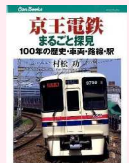
『京王電鉄まるごと探見 100年の歴史・車両・路線・駅』

いずれも、世田谷区内を走る鉄道各社の社史です。各社とも鉄道の歴史だけではなく、鉄道会社の事業全般を記しています。これらの資料中には、幻となった東京山手急行電鉄、現在の井の頭線の帝都電鉄、かつて区内に短期間存在した新奥沢支線、代田連絡線に関する記述があります。