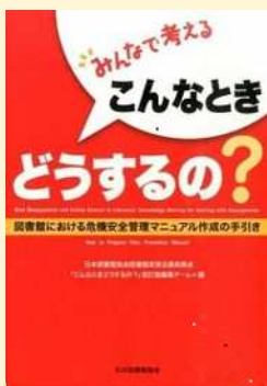
みんなで考える こんなときどうするの?

空き家の所有者になってしまった場合の空き家の管理や、管理されない空き家の予防などがまとめられている小冊子です。空き家等に関する相談窓口の一覧も掲載されています。