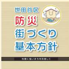
世田谷区 防災街づくり基本方針

大規模地震を対象とした防災街づくりの考え方をまとめ、策定された方針です。平成23年に発生した東日本大震災を受け、その後の社会情勢を踏まえ改定されたものです。