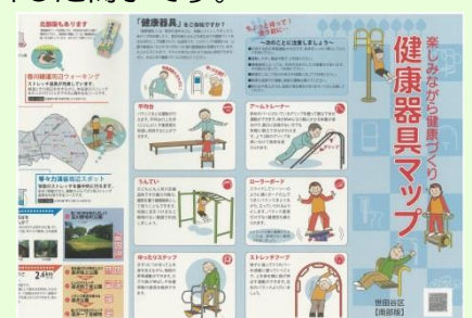
健康器具マップ - 南部版