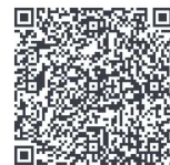
ビジネス書検索結果一覧 (世田谷区図書館HP)

経営管理や統計、マーケティング等、仕事や就活に役立つ様々な分野の書籍を揃えています。新刊も毎週購入しています。読みたい本のリクエストも受付しています。