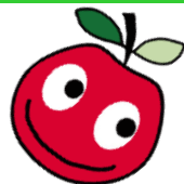
りんごのたなロゴマーク