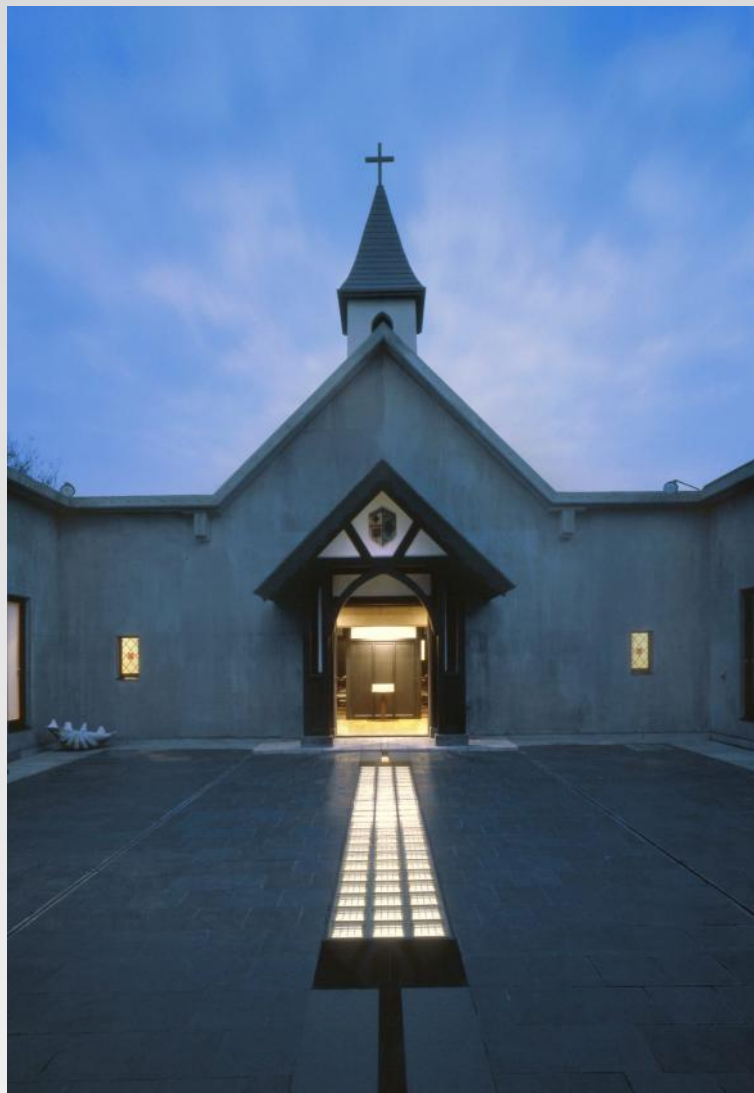
松沢資料館に移築された旧松沢教会（開館当時の様子）