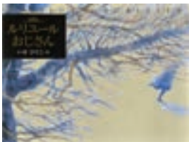
『ルリユールおじさん』 作：いせひでこ 理論社

木のこぶのような、おじさんの魔法の手で生まれ変わった「わたしだけの本」を抱きしめるソフィー。ルリユールという言葉には、「もう一度つなげる」という意味もあるそう。パリの路地を歩いているような青が印象的な絵、ラストのページも感動的です。