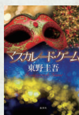
マスカレード・ゲーム 著：東野圭吾 集英社