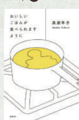
おいしいごはんが食べられますように 著：高瀬隼子 講談社