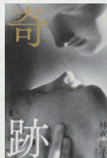
奇跡 著：林真理子 講談社