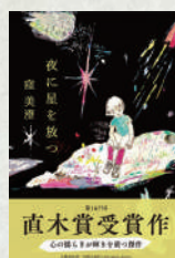
夜に星を放つ 著：窪美澄 文藝春秋