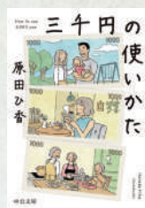
三千円の使いかた (中公文庫) 著：原田ひ香 中央公論新社