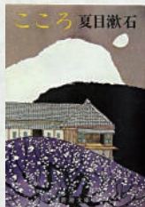
こころ 著：夏目漱石 新潮社