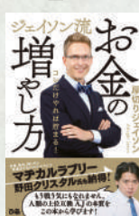
ジェyson流 お金の増やし方 著：厚切りジェyson ぴあ