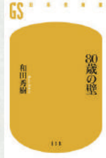
80歳の壁 (幻冬舎新書) 著：和田秀樹 幻冬舎