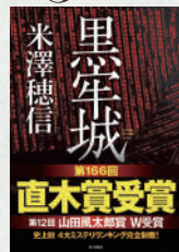
黒牢城 —Arioka Citadel case— 著：米澤穂信 KADOKAWA