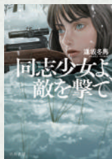
同志少女よ、敵を撃て 著：逢坂冬馬 早川書房