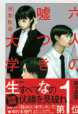
六人の嘘つき大学生 著：浅倉秋成 KADOKAWA