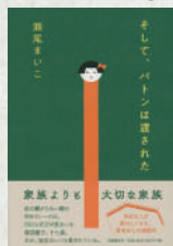
そして、パトンは渡された 著：瀬尾まいこ 文藝春秋