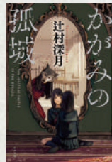
かがみの孤城 著：辻村深月 ポプラ社