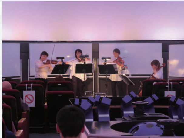
弦楽四重奏団「レガロ ムジカ アンサンブル」による演奏

終演後のアンケートでは、「プラネタリウムと曲がマッチして感動した」「子どもも楽しんで聴けてよかった」などの感想が多く寄せられました。