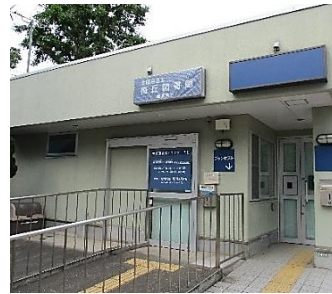
うめがおかとしょかんかりじむしょ 梅丘図書館仮事務所

うめがおかとしょかんかりじむしょ 梅丘図書館仮事務所では 予約した本の受け取りや、 借りた本の返却ができます。