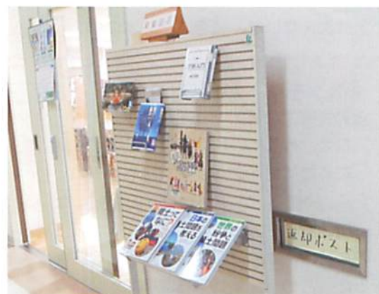
右下に返却ポストがあります

図書室が閉まっている時にも本が返却できるように、図書室入口わきに返却ポストもあります。部活で遅くなった時にも本を返すことができるので、とても好評だそうです。