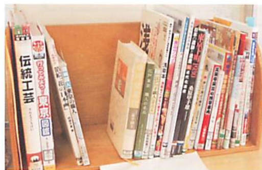
区立図書館が配送した資料

各クラスの廊下にはその成果が張り出されていました。区立図書館の資料が、図書館を飛び越えて中学校で有効活用されていることをとてもうれしく思います。