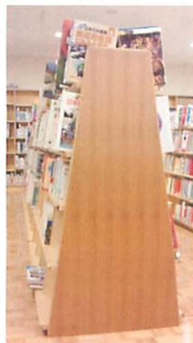
本がアピールする書棚

図書室全体に圧迫感がなく、広々とした雰囲気なので、これなら落ち着いて読書や調べ物ができそうです。