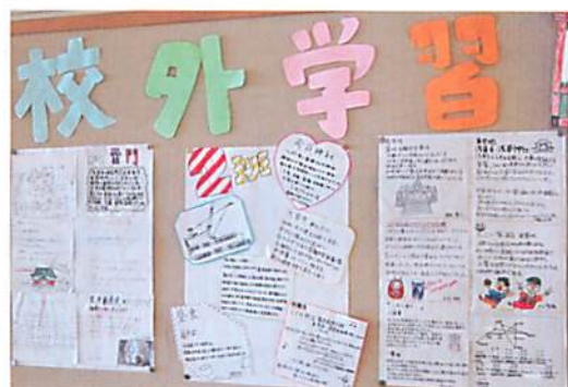
みんなでまとめました

活発な活動をしている船橋希望中学校の図書室。 これからも区立図書館はサポートしていきますよ！