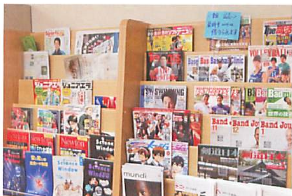
充実した雑誌コーナー