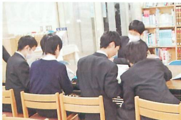
休み時間に雑誌を読む生徒たち

週に4回図書室を利用するという1年生の男子は、この図書室の良いところとして、「本が多いこと」と「雑誌・新聞が豊富」ということを挙げてくれました。1年生の女子からは「図書室の先生が探している本をすぐに見つけてくれる」との声も上がりました。