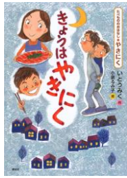
「きょうはやくい」 いとつみく作 小泉るみ子絵