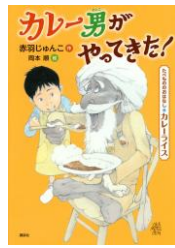
「カレー男がやってきました!」 赤羽じゅんこ作 岡本順絵